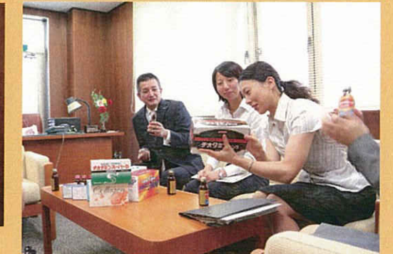
永遠のヒット商品「チオタミンD」を試飲させていただきました

日新薬品工業様が「置き薬」のシステムをされているのは、高齢者の方が元気に過ごせるよう、日頃の生活習慣病の予防・治療を心がけてもらいたいからだと思います。一人暮らしの高齢者にとっては、お薬を届ける時に話をするだけでも喜んでもらえるようで、直接「良くなったよ。ありがとう。」と言っていたことがやがていにも繋がっているようでした。また、高齢化社会が進む中で、日本の製薬産業はこれから市場の拡大が見込まれる数少ない産業の一つだと思います。そのような業界で「置き薬」というビジネスモデルをはじめられているこの会社に将来性を感じました。