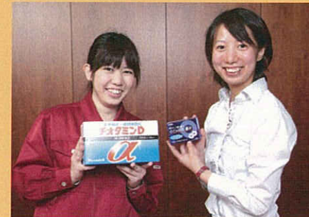
発売当初から変わらないパッケージ